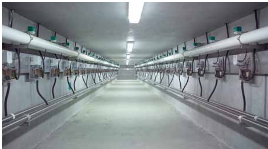
Исполнение: Global 90i с Subway

При таком исполнении важные при сервисном обслуживании компоненты доильной техники монтируются внизу под доильной ямой (центральный подвал) либо под тем местом (двойной подвал), где стоят животные. Система Subway обеспечивает чистоту, сухость и доступность рабочего места, а так же даёт возможность проведения сервисных работ непосредственно во время доения. Благодаря всему этому срок службы всех важных компонентов значительно возрастает.