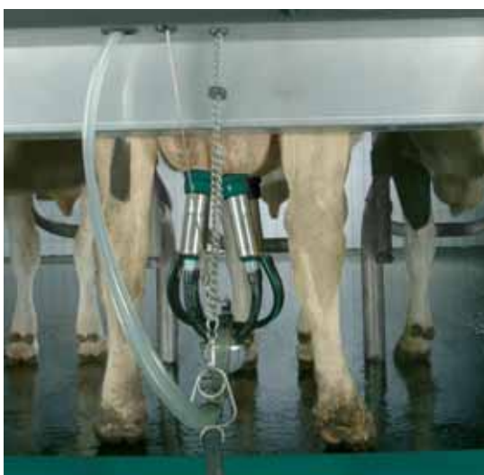
Контурбаланс обеспечивает поддержку и направление шлангов